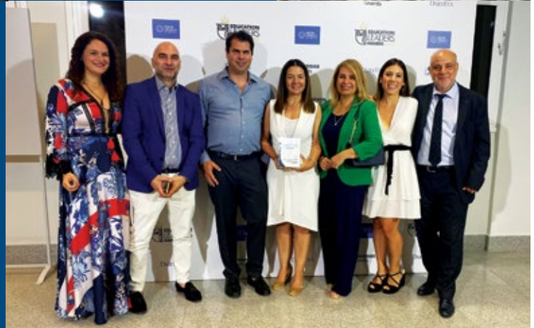
▶ Βράβευση IST College, για το Πρόγραμμα "MBA για Γονείς", Education Leaders Awards 2023