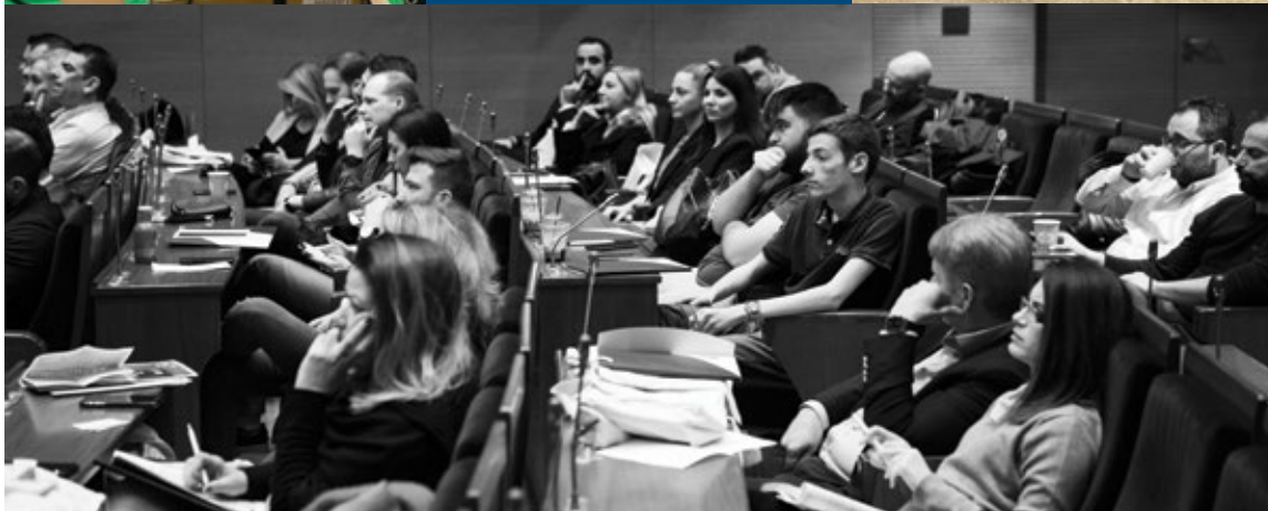
◀ Παρακολούθηση Διάλεξης στο ΕΒΕΑ, στο πλαίσιο του IST on site