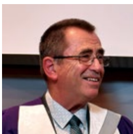
Ιωάννης Θανόπουλος Πρύτανης Ομότιμος Καθηγητής στο Πανεπιστήμιο Πειραιώς