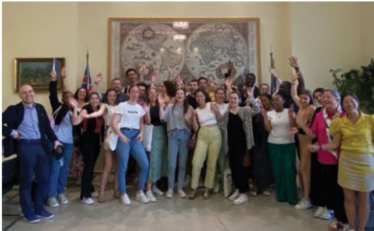
◀ Φοιτητές από το Sorbonne Business School στο IST College για Study Abroad