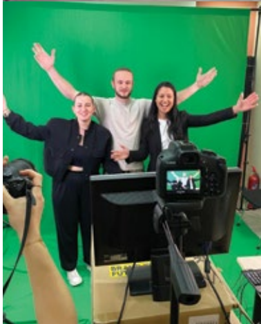
◀ Testimonials Γάλλων φοιτητών