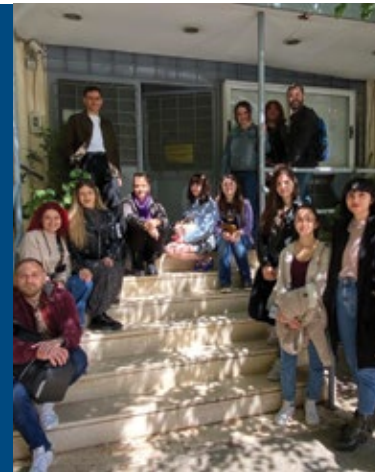
▶ Επίσκεψη φοιτητών Ψυχολογίας στο Εγκληματολογικό Μουσείο